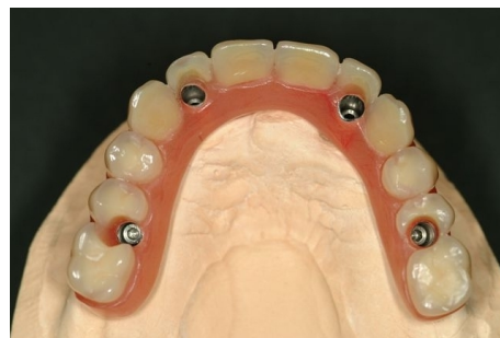
la prothèse est fixée par vissage sur les 4 implants