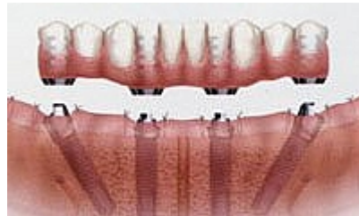
vue schématique du bas