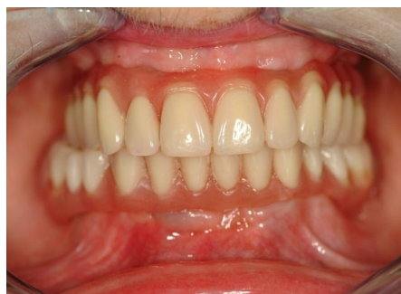
vue finale d'un haut et bas