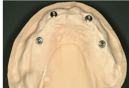
empreinte avec les 4 implants