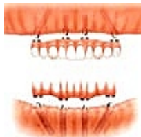
exemple schématique du haut et du bas