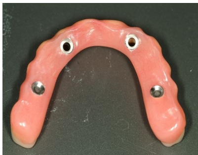
le dessous de la prothèse